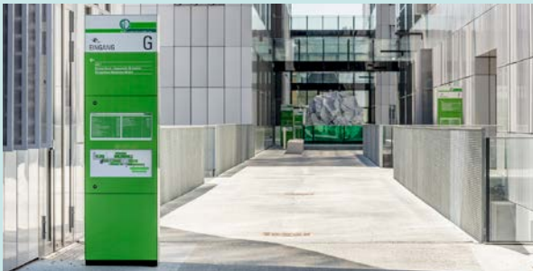
Innen- und Außenbeschilderung