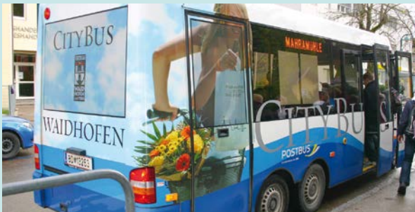
Werbetechnik: Sieb- und Digitaldruck, Display, Ausstellungswerbung, Klebefolien und Schilder