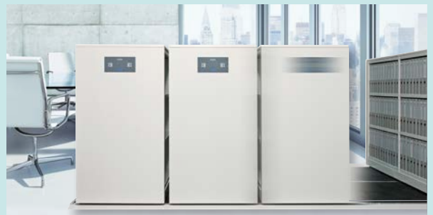
Verfahrbare und stationäre Regalsysteme

Weitere Informationen zu unserem Produktprogramm finden Sie unter www.forster.at